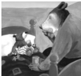
© “Encore un bisou” Any Hest & Anita Jeram