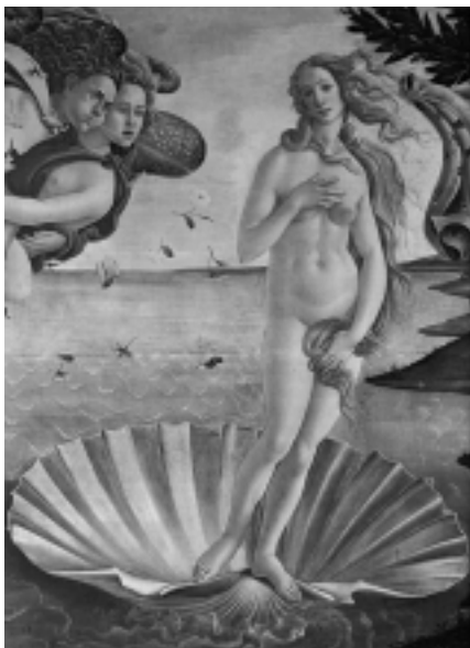
“La naissance de Venus” Botticelli

Au cours des XV ème et XVI ème siècles en Italie, période d'essor du nu féminin, apparaissent des tableaux commandés à l'occasion d'événements: mariages, naissances... Certains peuvent être dotés de caractéristiques liées à la sensualité ou à la cruauté. C'est ce que vous pourrez découvrir avec des peintres tels que Botticelli, Giorgione, Titien.